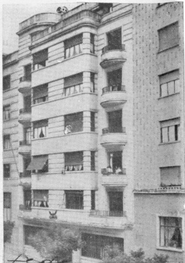
Vivienda: Vitoria, núm. 9