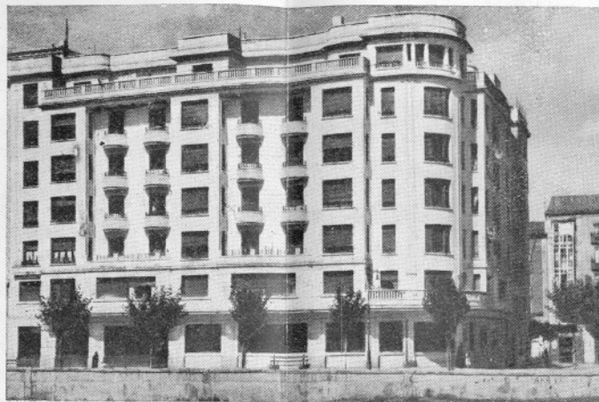
Casa de vecindad: Héroes del Alcázar, núm. 4