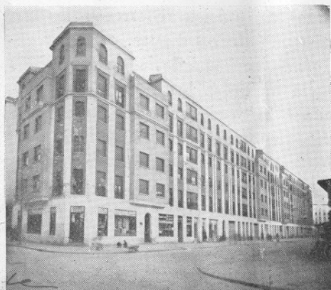
Bloque «Defensores de Oviedo»