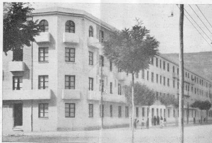
Bloque «Padre Flórez»